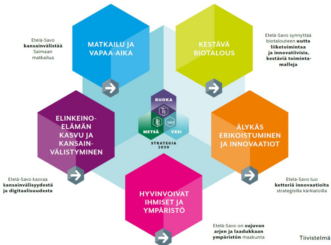
Kuva 2. Etelä-Savon maakuntaohjelman teemat ja tavoitteet

Maakuntavaltuusto hyväksyi marraskuussa 2017 ( esitys maakuntavaltuustolle 20.11.2017 ) Etelä-Savon maakuntaohjelman vuosille 2018–2021. Maakuntaohjelma perustuu maakuntastrategian kolmelle kärjelle – metsä, ruoka, vesi – ja sen tavoitteet ja toimenpiteet edistävät ihmisten hyvinvointia, elinkeinoelämän kasvua ja kansainvälistymistä, matkailua, biotalouden tuotantoa sekä älykästä erikoistumista. Maakunnan yhteistyöryhmä hyväksyi syyskuussa 2017 uuden maakuntaohjelman sisältöön ja rakenteeseen perustuvan toimeenpanosuunnitelman vuosille 2018–2019.